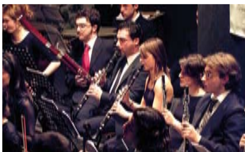
Un concerto del C.I.D.

E poi uno sguardo al futuro attraverso uno spettacolo offerto a tutti i bambini della provincia con la presenza viva di una delle più importanti orchestre italiane, la "Verdi" di Milano, affiancata da un brillante attore che "racconta" agli alunni delle scuole l'orchestra con i suoi strumenti. Si tratta della "Guida del giovane all'orchestra", una serie di variazioni scritte a scopo didattico