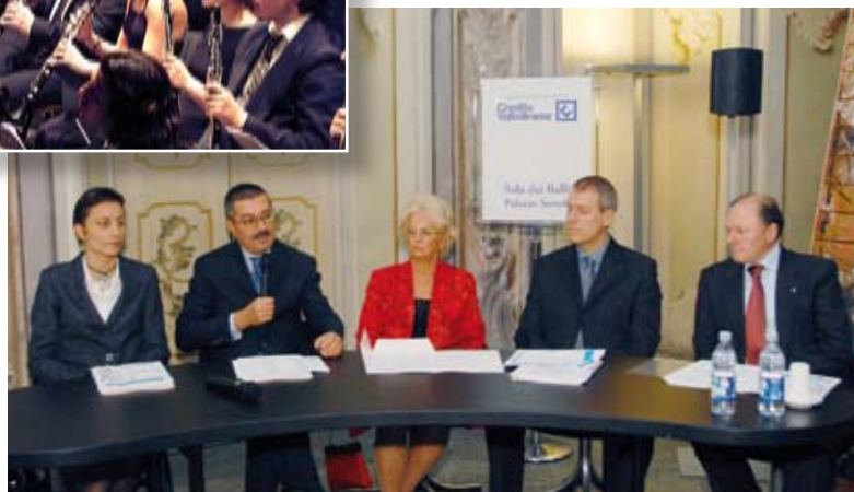
La presentazione, a Palazzo Sertoli, della stagione musicale del C.I.D.